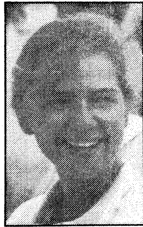
La infanta Cristina

LA INFANTA CRISTINA presidirá el próximo viernes, en Isla Cristina (Huelva), el acto oficial de la botadura de la carabela “Pinta”, que, junto a otras dos naves réplicas de las utilizadas por Cristóbal Colón, han sido construidas por encargo de la sociedad estatal para el V Centenario en conmemoración del descubrimiento de América. Con la botadura de la “Pinta” se procederá a poner a flote las tres embarcaciones que, posteriormente, reproducirán la travesía de Cristóbal Colón. Una de estas embarcaciones, la “Santa María”, se construye en los astilleros de Barcelona.